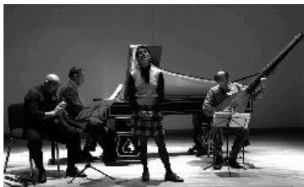
L'ensemble Auser Musici

...nasce dall'esigenza di creare nel settore della musica antica un più proficuo confronto tra speculazione teorica e prassi, tra ricerca musicologica e produzione musicale