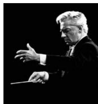
Il leggendario direttore d'orchestra H. von Karajan

E' evidente che questi termini lasciano all'esecutore un ampio margine di discrezionalità, ma non bisogna pensare che egli possa applicare l'agogica in piena libertà. Deve invece rifarsi continuamente allo stile per quel determinato tipo di musica, alla tradizione esecutiva per quell'autore, alle precedenti esecuzioni di quel brano di musicisti autorevoli. Con questo bagaglio di informazioni un